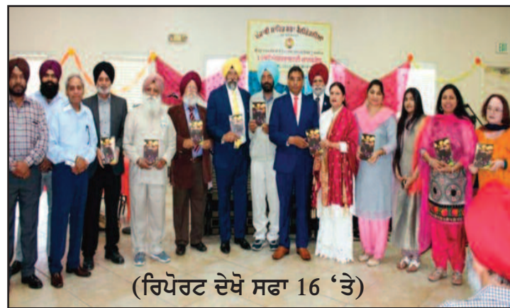
(ਰਿਪੋਰਟ ਦੇਖੋ ਸਫਾ 16 'ਤੇ)